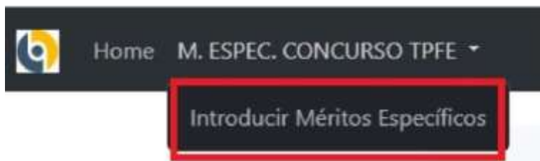
Figure 4. Opción Introducir ME

Para acceder a la opción, el solicitante deberá pulsar en "Introducir Méritos Específicos y Antigüedad"