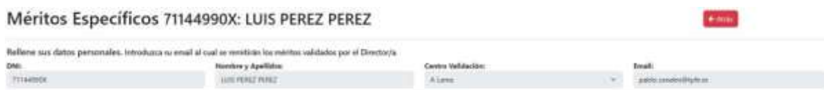
Figure 5. Datos Personales

Se introducirán los siguientes datos: DNI, Nombre y Apellidos, Centro de Validación y Correo Electrónico (al cual será remitido el certificado de los méritos específicos una vez que la Dirección del centro valide los datos)