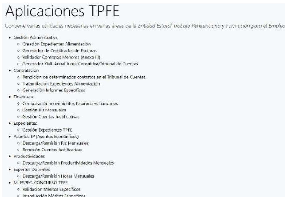
Figure 3. Home

Describe de forma breve las distintas utilidades que forman parte de la aplicación.