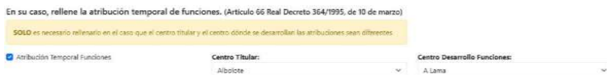
Figure 6. Atribución Temporal Funciones

En el caso de que el funcionario realice la atribución temporal de funciones (Artículo 66 Real Decreto 364/1995 de 10 de marzo), se introducirán los siguientes datos: