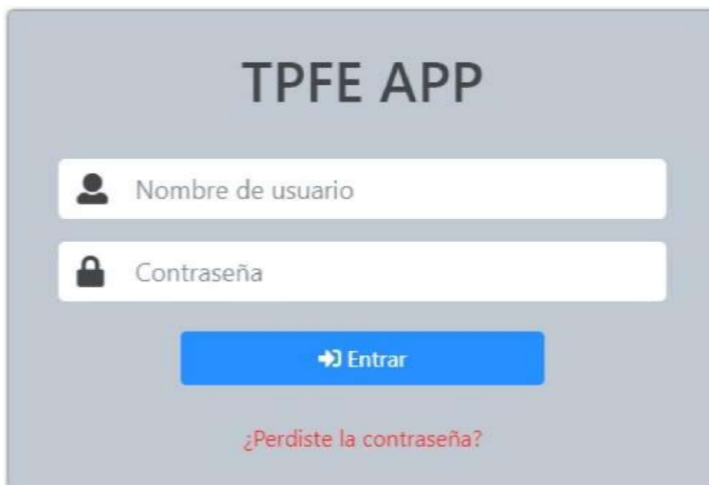
Figure 1. Pantalla de Acceso